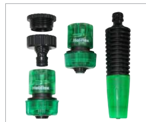
Kit de Accesorios para Riego