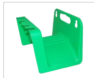
Colgador para Mangueras